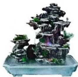
重叠式（群峰重叠、雄伟壮丽）