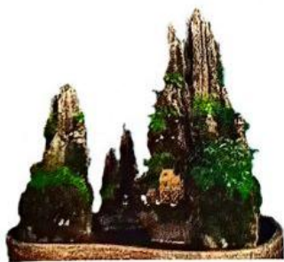
峡谷式（两组陡峭山峰，中间峡谷）