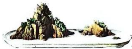
平远式（主峰、次峰、配峰三角形布局）