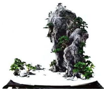
偏重式（主峰雄秀，配峰低矮）

山水盆景常见的造型布局形式可分为偏重式、孤峰式、散置式、平远式、峡谷式、重叠式、群峰式、开合式等。