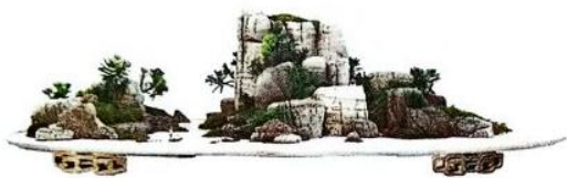
散置式（从峰众多，错落有序）