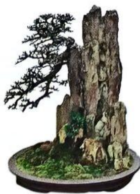
孤峰式（孤峰耸立，气势险峻）